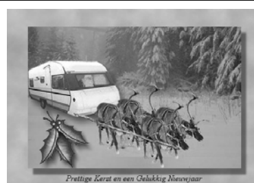
Prettige Kerst en een Gelukkig Nieuwjaar

Solifer 500L bj 1989 extra's draaibaar toilet, zonnepaneel, elec boiler en elec verwarmingselement.prijs notk tel 0573-431359