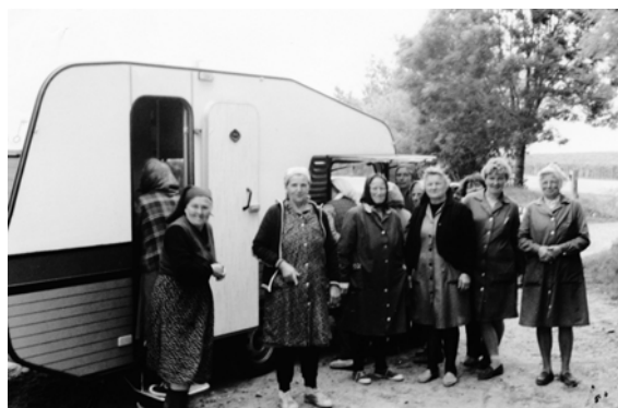
Oude tijden, tijdens een lunchpauze in Eger Hongarije werden we verrast door een aantal druivenpluksters die wel eens een solifercaravan van binnen wilden zien.