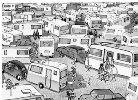
Mama, waar staat onze caravan?