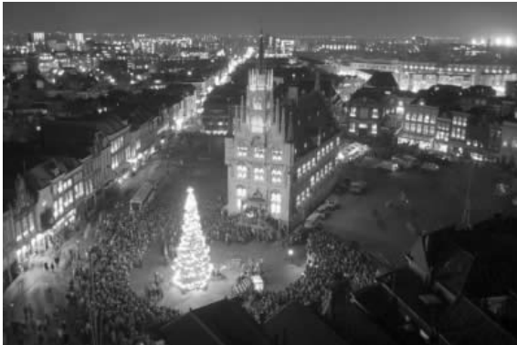
Kaarsjesavond in Gouda

Vlist en de meren in dit Zuid-Hollandse landschap zijn meer dan een bezoekje waard. In een nummer van de KCK (maart 2003) stond deze Gouden tip: op de fiets naar Haastrecht (vanuit Schoonhoven) en dan per kano de Vlist afzakken, dat is pas vakantie! De historische Oudhollandse binnenstad