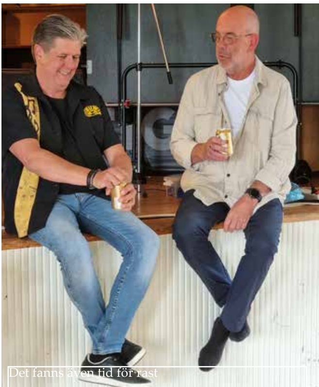
Det fanns även tid för rast