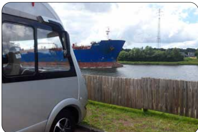
Schacht-Audorf vid Kiel kanalen