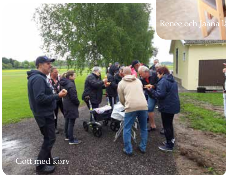
Gott med korv