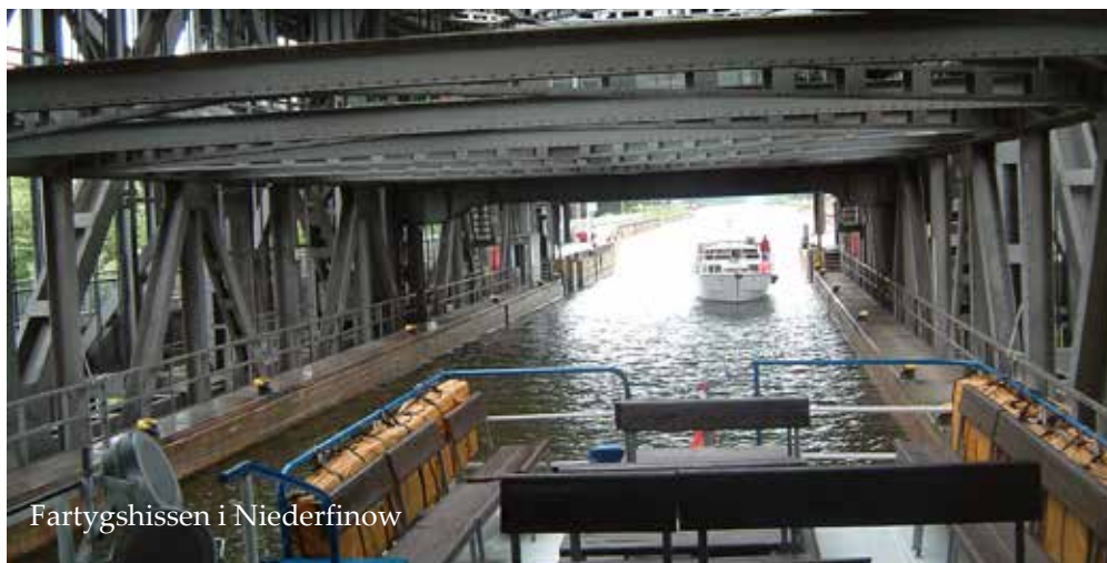
Fartygshissen i Niederfinow