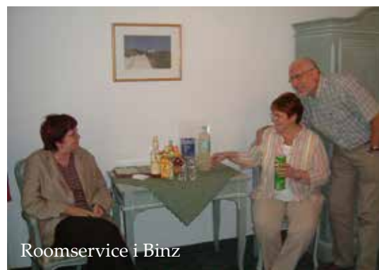
Roomservice i Binz

Trist väder var den vår näst sista dag men ändå som alla andra dagar på resan, fylld med nya upplevelser och trevlig samvaro. Middag på hotellet, där vi saknade servitören från kvällen innan! Sov tidigt då vi skulle upp tidigt för packning av bilen 06:50 på onsdag.