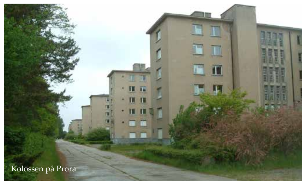
Kolossen på Prora