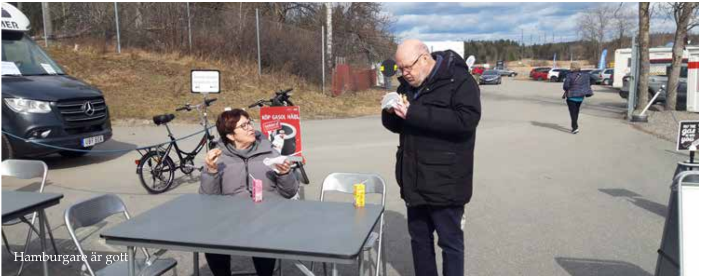
Hamburgare är gott