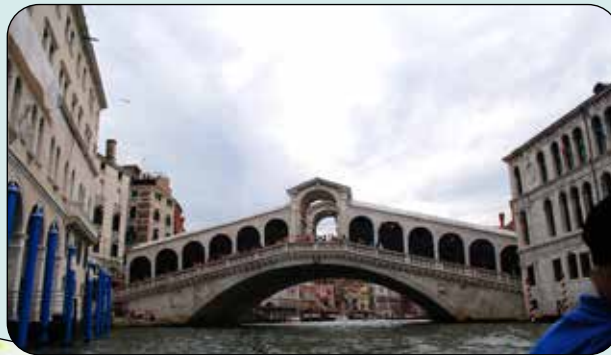
Gondol tur i Venedig 2017