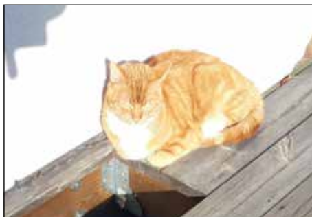
Familjens soldyrkare nr 1.