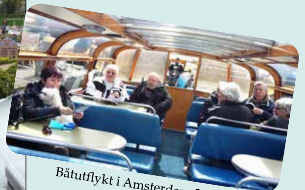
Båtutflykt i Amsterdam 2016