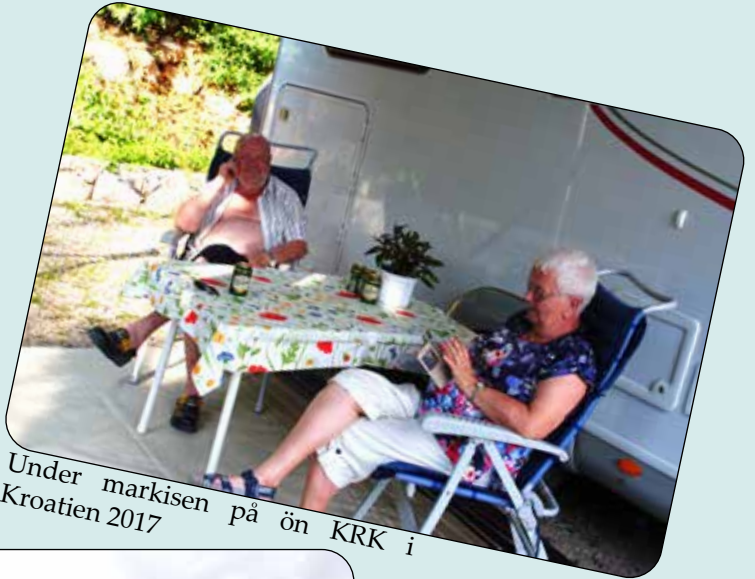
Under markisen på ön KRK i Kroatien 2017