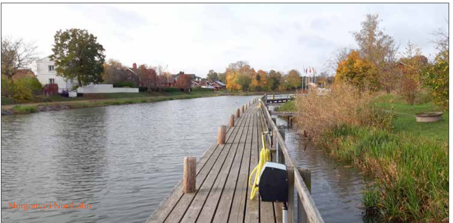
Morgonvy i Norshelm