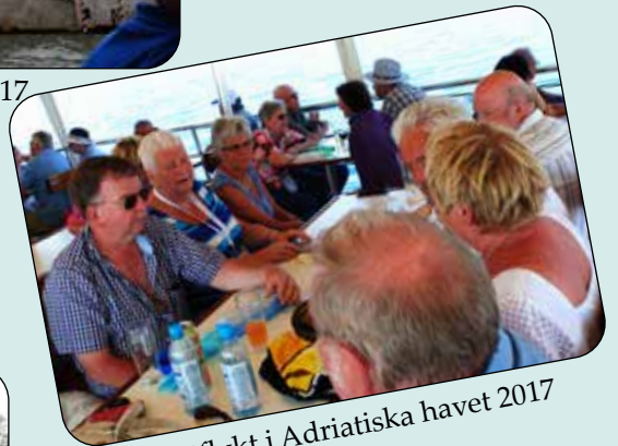
Båtutflykt i Adriatiska havet 2017