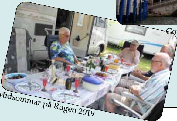
Midsommar på Rugen 2019