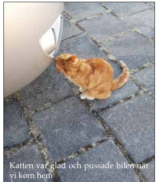
Katten var glad och pussade bilen när vi kom hem