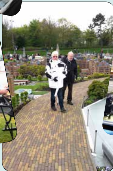
Kylslaget Madurodam i Holland 2016