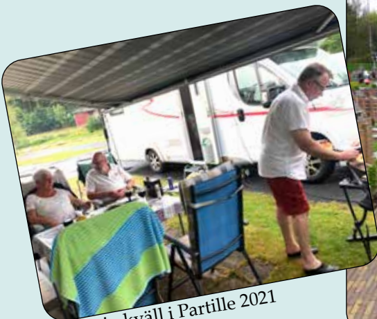
Regnig kväll i Partille 2021