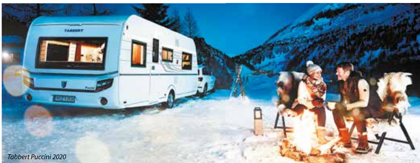
Tabbert Puccini 2020

Ook scoorden de merken Weinsberg (in betaalbare caravans), Knaus (in het campersegment), en ook bij de motorhomes het merk Morelo op dit prijzenfestival te Düsseldorf.