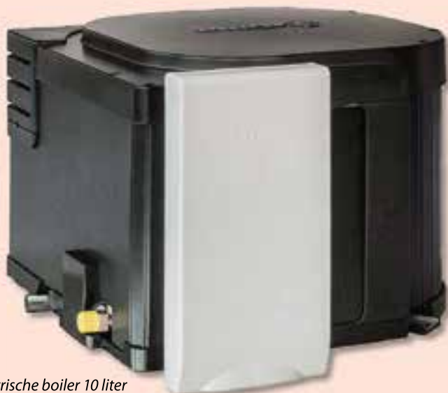
Truma gas-/elektrische boiler 10 liter

continu opnieuw verwarmd, terwijl je bijvoorbeeld aan het douchen bent. Alleen water verwarmen op elektriciteit gaat natuurlijk ook, hiervoor kan de temperatuur door middel van een (ander) paneeltje worden ingesteld op 850 W en 1300 W.