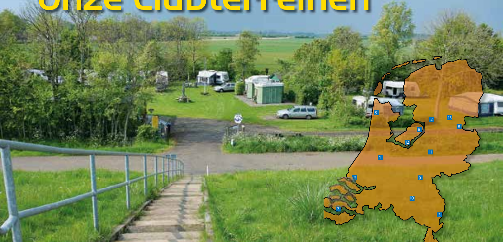
Terrein Zuudschorre in Ellewoutsdijk