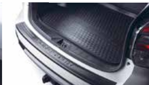
ACHTERBUMPER BESCHERMPLAAT + BAGAGEMAT