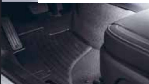
RUBBER MATTENSET VOOR & ACHTER