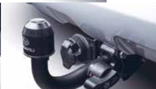
TREKHAAK MET 13-POLIGE AANSLUITING