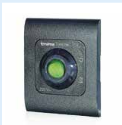
Truma Therme controlepaneel 5 liter