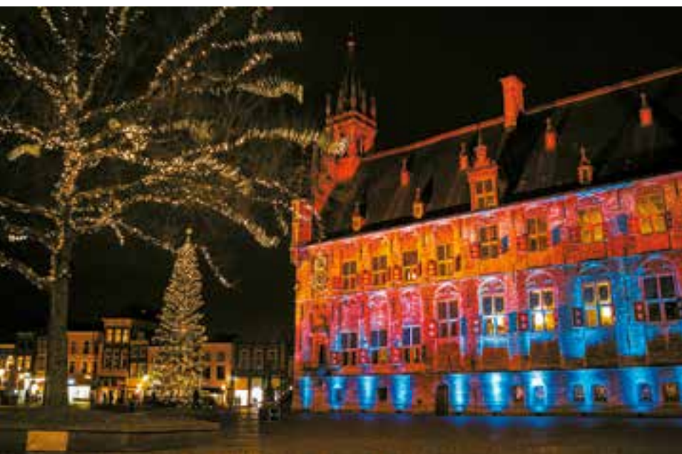
Gouda bij kaarslicht

Onderweg bestaat weer de mogelijkheid om in het restaurant Boshuis Drie te lunchen, facultatief voor € 10,- p.p. Voor de lunch hebben we een 'twaalf-uurtje' afgesproken, dat zal bestaan uit een kommetje soep, twee sneetjes brood, met ham, kaas en een kroket en naar keuze een kopje koffie, thee of melk. Voor de avond hebben we (ook facultatief) drie rijkgepulverde stampotten voor u laten bereiden in het restaurant, de prijs hiervoor is € 8,50 p.p., exclusief drankjes.