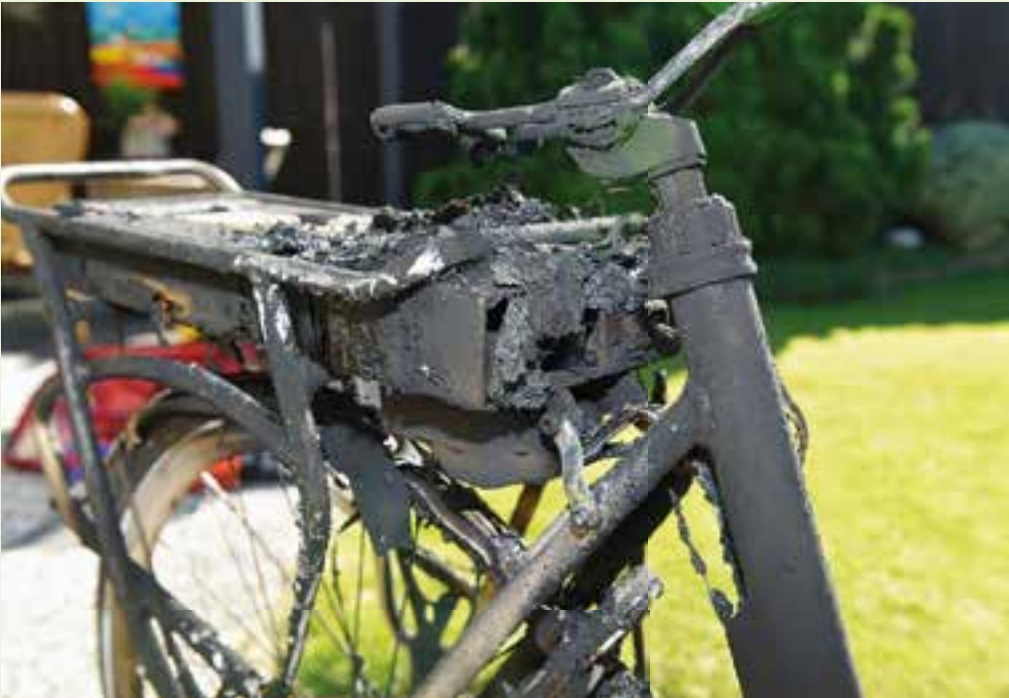
De fiets stond niet aan de lader/stroom en is toch spontaan in brand gevlogen