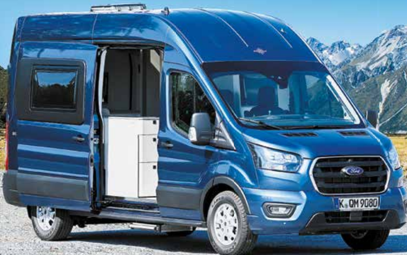
Ford Big Nugget Concept

Wanneer de Big Nugget Concept op de Europese markt wordt gebracht, naast de onlangs geïntroduceerde Transit Custom Nugget, wordt momenteel onderzocht.