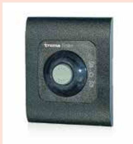
Truma gas-/elektrische boiler 10 liter watersysteem controlepaneel gasinstelling