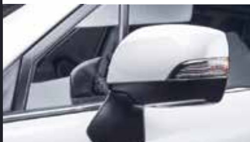
AUTOMATISCH INKLAPBARE SPIEGELS