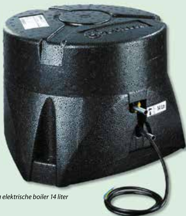
Truma elektrische boiler 14 liter

verwarmen gaat razendsnel, ondanks het grote waterreservoir. Door zijn beperkte afmetingen van Ø ±40 cm en een hoogte van slechts 30 cm neemt de elektrische boiler van Truma weinig ruimte in.