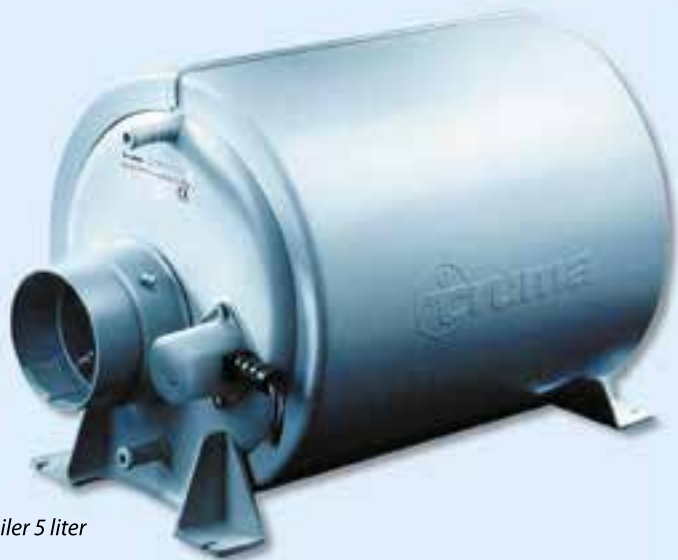
Truma Therme boiler 5 liter

Als deze temperatuur te warm is voor u, dan kunt u de temperatuur regelen door toevoeging van water via de koudwaterkraan, bijvoorbeeld bij het douchen.