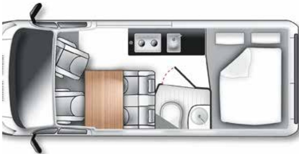
Indeling 2019 van de Ford Big Nugget Concept

Hadden camperliefhebbers al eerder dit jaar kennism gemaakt met de nieuwe Ford Transit Custom Nugget, tijdens de Caravan Salon in Düsseldorf