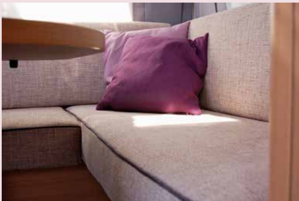
LMC Style 440 D Comfort met unieke stoffering

caravan ook nog eens comfortabel geprijsd, namelijk vanaf € 18.980,-.