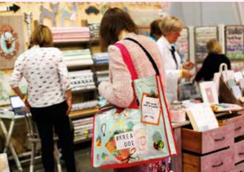
KreaDoe 2019 is snuffelen, kijken, voelen, proeven en ideeën opdoen

Dit jaar viert KreaDoe haar 30 e verjaardag van 30 oktober tot en met 3 november.