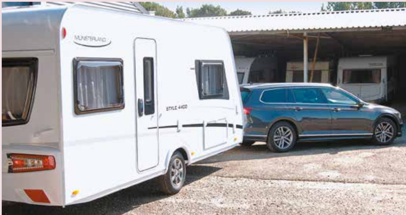
LMC Style 440 D Comfort buitenaanzicht

LMC lanceerde een speciaal voor de Nederlandse markt ontworpen en gebouwd nieuw model, namelijk de comfortabele LMC Style 440D Comfort op de onlangs gehouden 50PlusBeurs. De Style 440D Comfort is dan ook met ingang van het modeljaar 2020 opgenomen in het LMC-programma.