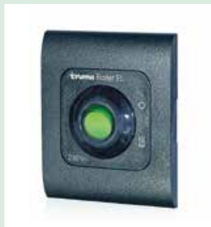
Truma elektrische boiler 14 liter controlepaneeltje elektrische boiler