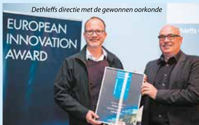
Dethleffs directie met de gewonnen oorkonde

Zoals u wellicht weet maakt Dethleffs deel uit van de Erwin Hymer Group waartoe ook behoren de caravan- en kampeerautomerken Buccaneer, Bürstner, Carado, Compass, Elddis, Eriba, Etrusco, Hymer, Laika, LMC, Niesmann+Bischoff, Roadtrek, Sunlight en Xplore. De Erwin Hymer Group had afgelopen jaar een omzet van 2,1 miljard euro en produceerde rond de 55.000 vrijetijdervoertuigen, maar geeft wereldwijd ook werk aan meer dan 6.000 medewerkers.