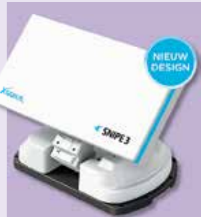
Xsarius Snipe 3