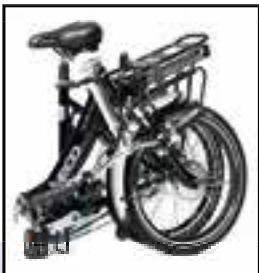
Eco Traveller 2018 Eco Traveller ingevouwen

van vormgeving, maar ook is de capaciteit is vergroot. En voor de kilometerreters is er tegen meerprijs een accu verkrijgbaar met een vermogen waarmee een afstand kan worden overbrugd van ruim 100 km met trapondersteuning. Zowel het zadel als het stuur zijn zonder gereedschap te verstellen en verder beschikt de Eco over 7 versnellingen.