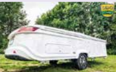
iCamp vouwwagen ingevouwen

Uiteraard trok de Coco van Dethleffs weer de nodige belangstelling, maar ook het actiemodel van Adria, de Altea 492 UL, lokte heel wat kijkers naar binnen. En wat gezegd moet worden: Adria biedt veel caravan voor je geld.