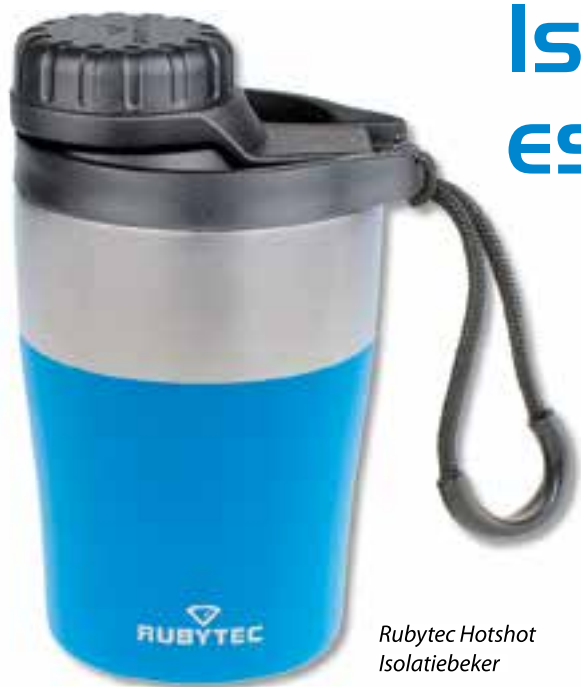
Rubytec Hotshot Isolatiebeker