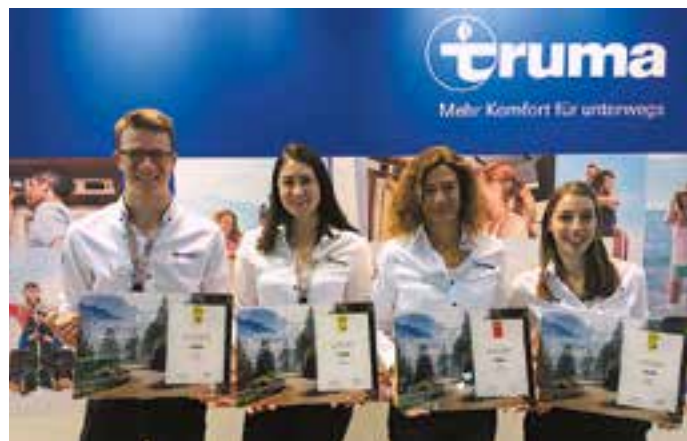
Truma viel ook in 2018 weer volop in de prijzen

Het wordt zo langzamerhand traditie, maar ook dit jaar gaat Truma weer met een flink aantal prijzen naar huis. Zo is Truma op de CMT beurs in Stuttgart alweer voor de 4 e keer verkozen tot het beste merk.