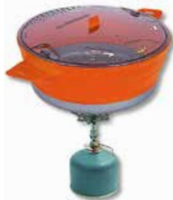
Pan op het vuur

De X-Bowl is een lichtgewicht kom met een inhoud van 650 ml en de X-Mug is een beker met een inhoud van 480 ml die zo plat is op te vouwen dat hij moeiteloos in een rugzak past.