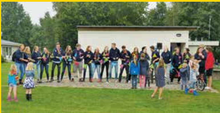
Antwoord: JKC 55

Weet jij nog tijdens welk kampje deze foto gemaakt is?