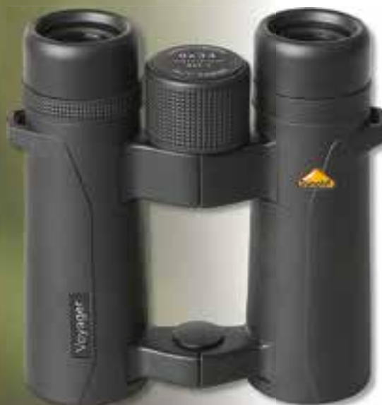
Bynolyt Voyager WP 8 x 34