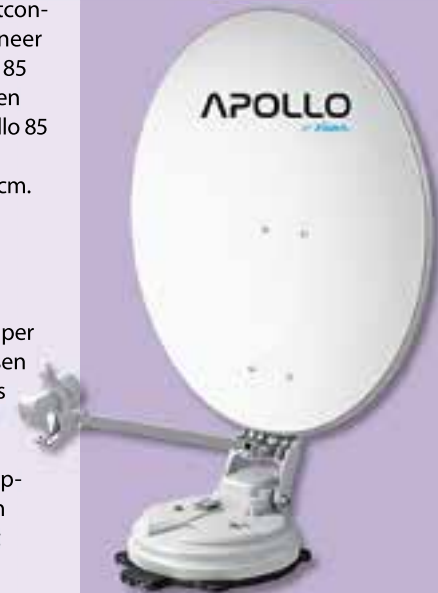
Xsarius Apollo 85