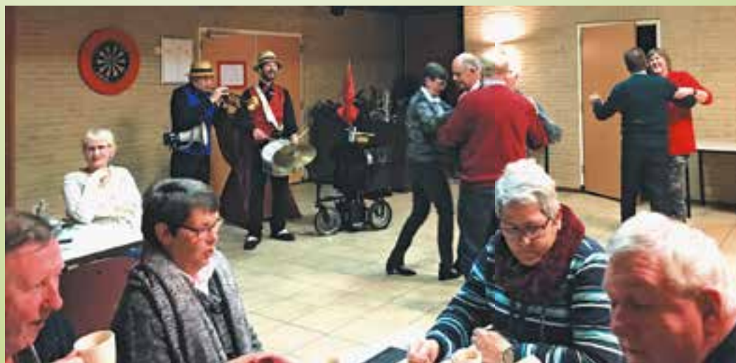
Beentjes van de vloer met Dixielandband Swingmasters

gros van de aanwezigen vond deze oplossing beslist een geweldige, ludieke voltreffer. Ieder van u die wel eens een kamp heeft georganiseerd weet dan ook uit ervaring dat het altijd woekeren is met het budget. Wij vonden dat deze kampcommissie een prachtcommissie had gevonden tussen binnen het budget blijven en toch een dixielandavond aan de gasten presenteren. Chapeau.