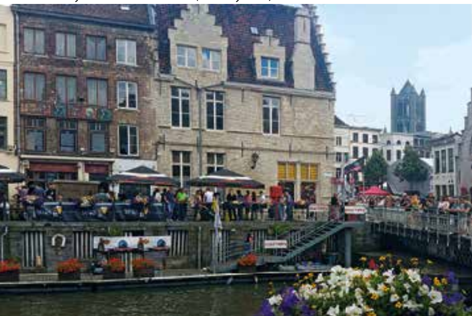
Gezinsrally Rond de Gentse Feesten