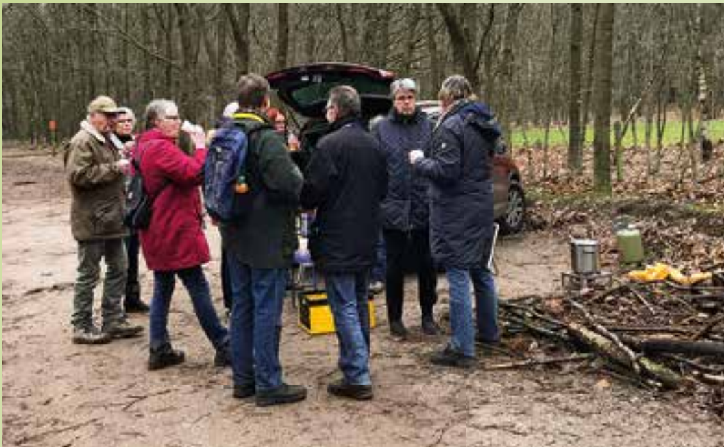
Halverwege de zwerfwandeling was er onder andere warme chocolademelk