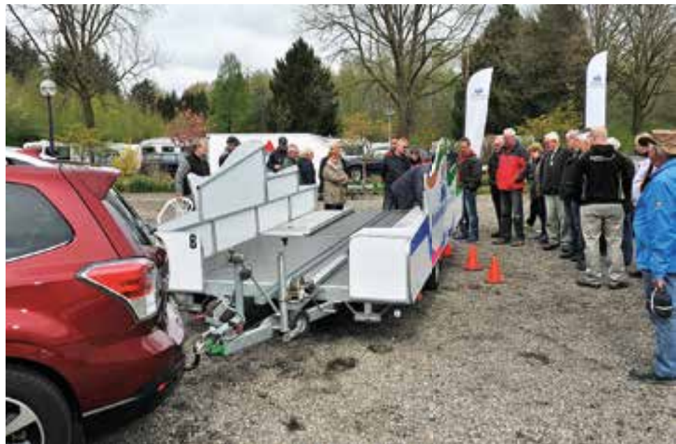
Uitleg van het Caravan-rijvaardigheidsteam met behulp van de 'klomp'