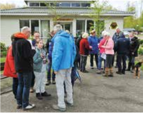
Entree De Distel in Zeewolde

Het bestuur nodigt de nieuwe leden van 2017 van harte uit om dit weekend kennis te komen maken met de NCC. Ook de leden van 2016 die nog geen kennismakingsweekend hebben bijgewoond, zullen nogmaals worden uitgenodigd. Het motto is: wat betekent de NCC voor u, maar ook: wat kunt u betekenen voor de NCC. Alle betreffende leden krijgen een uitnodigingsbrief, waarna zij zich kunnen aanmelden via de groene kaart die op de NCC-website staat.