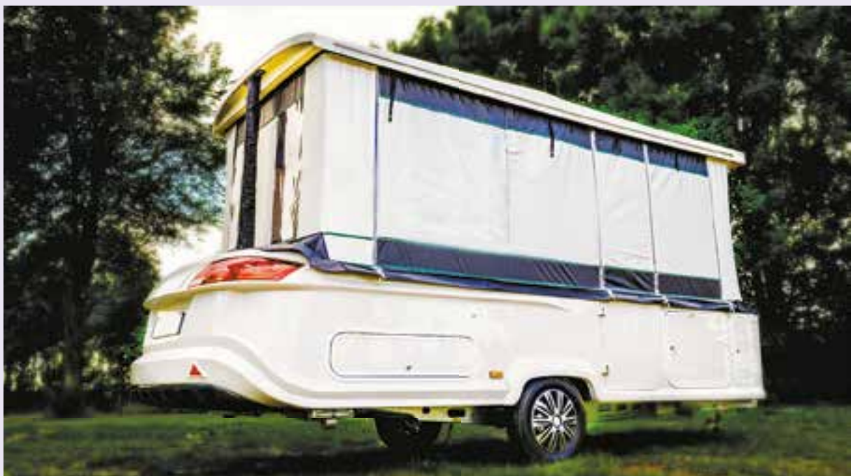
iCamp vouwwagen opgezet

Van donderdag 18 t/m dinsdag 23 januari vond de Noordelijke caravanbeurs de Caravana weer plaats. Deze was ook nu weer totaal volgeboekt om bezoekers te voorzien van al het nieuws op caravan- en campergebied, kampeeraccessoires, vouwwagens, campingaanbiedingen en voortenten.