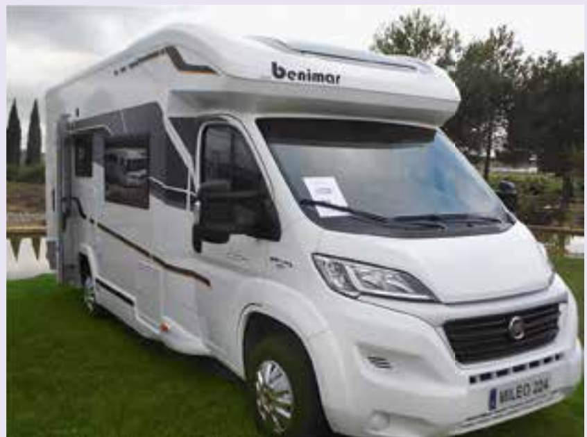
Benimar Mileo 224

De Benimar Mileo 224 is de eerste halfintegrale camper in Nederland die officieel 6 goedgekeurde zitplaatsen heeft. Deze zespersoons camper staat op een basis van een Fiat Ducato euro 6. De gehele opbouw is van polyester, met goede isolatie voor zomer en winter. Voorin vindt u een dubbele L-zit met uitklapbare tafel die in alle standen gemanoeuvreed kan worden. Ook voorin bevindt zich een hefbed, met hieronder een tweepersoonsbed op de dinette. Achterin is nog een stapelbed gesitueerd, evenals de douche en het toilet. De Benimar Mileo 224 staat voor ongeveer € 77.000,- in de showroom.