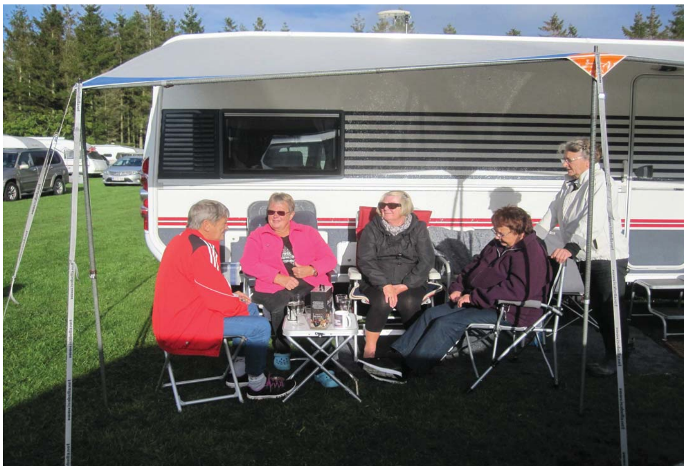
Efterårssolen nydes på Vestbirk Camping

www.soliferklub.dk --- info@soliferklub.dk