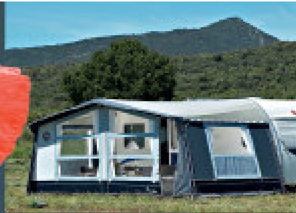
Opus 300 - 3 m diepte