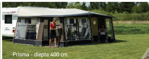
Prisma - diepte 400 cm

Kijk voor de gehele collectie en meer informatie op www.isabella.nl . Isabella Nederland BV · info@isabella.nl - 033-2541100