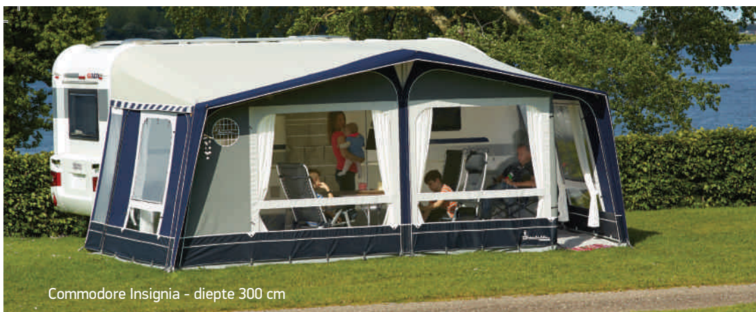
Commodore Insignia - diepte 300 cm