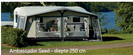
Ambassador Seed - diepte 250 cm