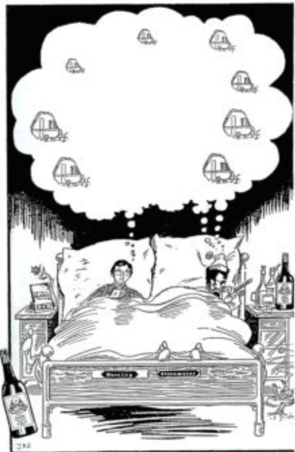
We had a dream