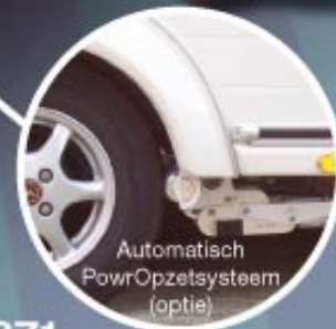
Automatisch PowrOpzetsysteem (optie)