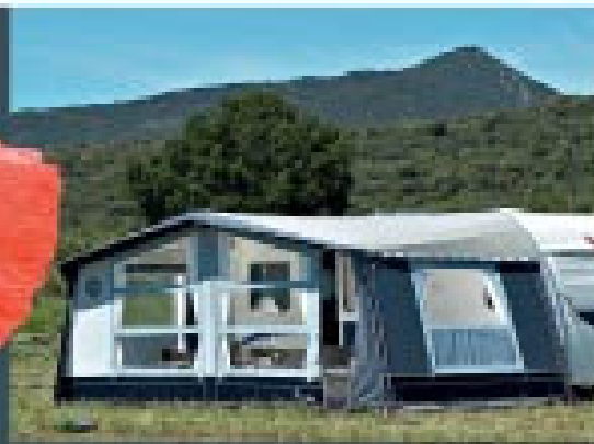
Opus 300 - 3 m diepte