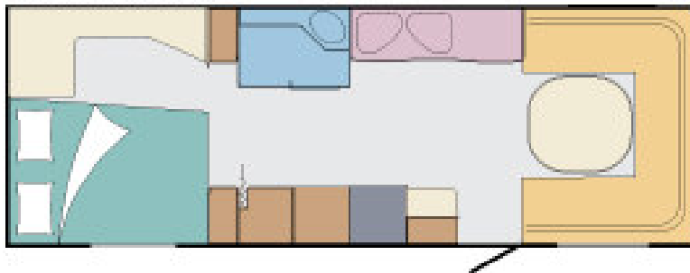
Finlandia 690 MHC

Nieuwe uitvoering van de MHC-indeling met bureau en TV-kast achterin (waarmee de extra kledingkast verdwijnt).