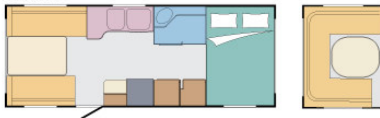
Artic 560 E

Artic 560 E met tweepersoonsbed voorin, de ingang deur en zitgroep achter de as (naar keus leverbaar met rondzitgroep of N-zitgroep met vaste tafel).